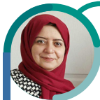
کتابیون ولی زاده PMO در صندوق ضمانت سرمایه‌گذاری صنایع کوچک