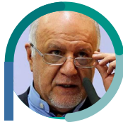
بیژن نامدار زنگنه